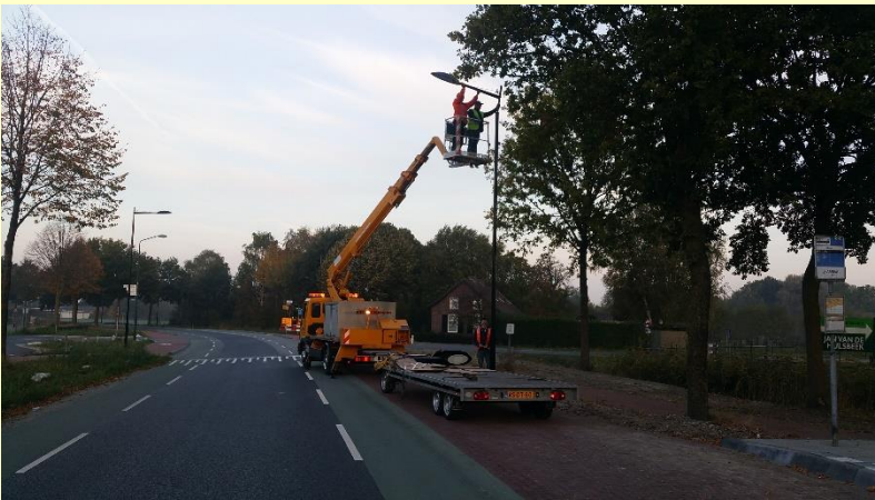
Nieuwe armaturen worden bevestigd aan de lichtmasten in de Molenstraat.

Een van de wensen die de werkgroep Wanroij in het voortraject van de reconstructie van de N602 heeft ingebracht, is een vervanging van alle straatverlichting door nieuwe ledverlichting. Nadat begin september de nieuwe lichtmasten werden geplaatst in de Dorpsstraat, werden vorige week ook op een volgend deel van het traject nieuwe lichtmasten geplaatst. Hier zijn medewerkers van de onderaannemer vanuit een hoogwerker bezig met het bevestigen van armaturen aan de masten ter hoogte van bedrijvenpark Molenveld.