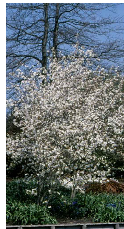
Amelanchier laevis (Al)