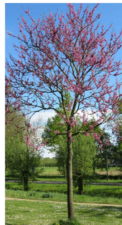
Cercis siliquastrum (Cs)