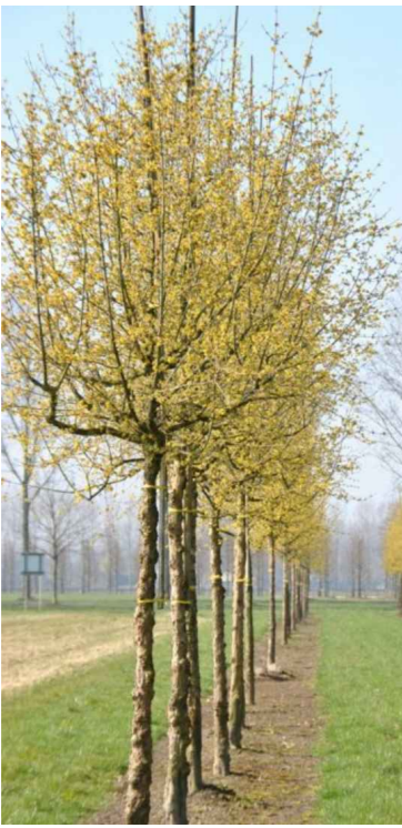
Cornus mas (Cm)